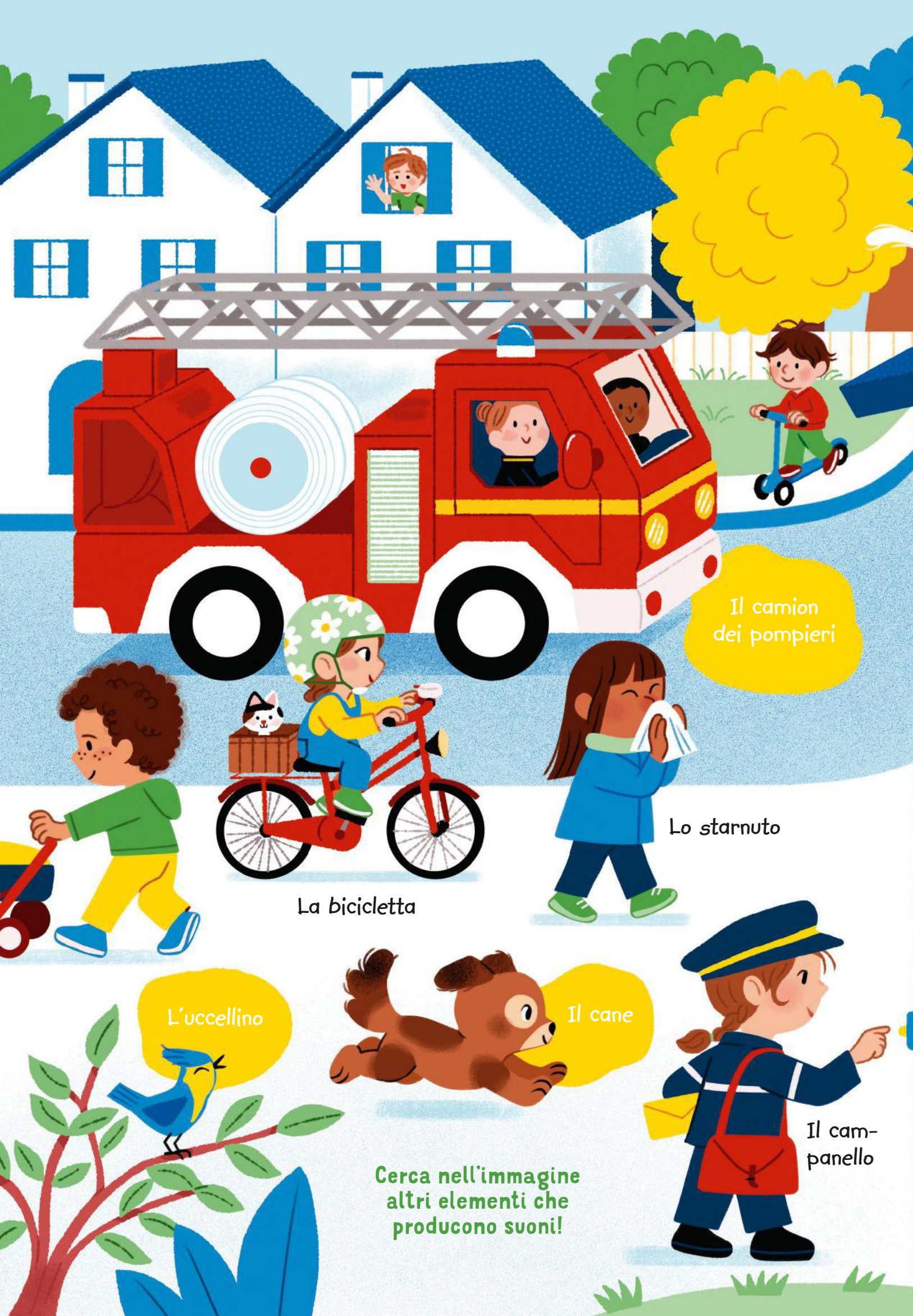
Il camion dei pompieri