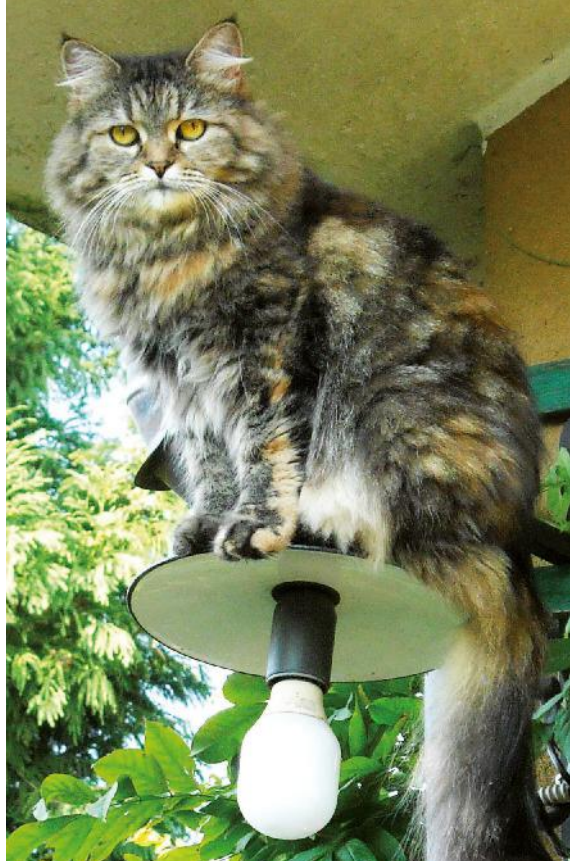
Ribbi, in versione coprilampione. 🐾 9