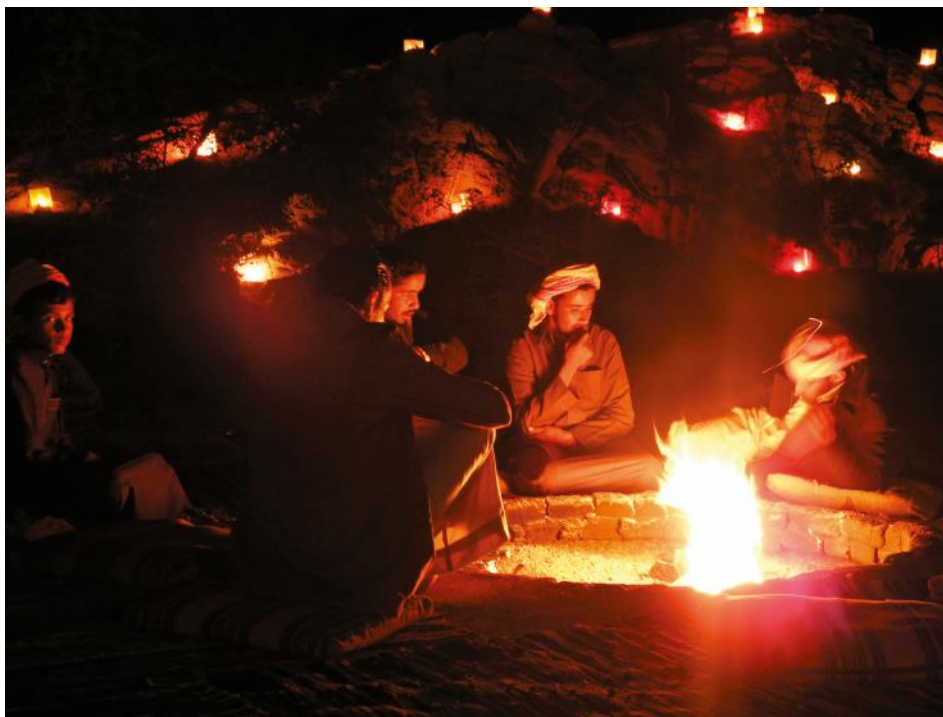
Attorno al focolare i beduini siedono a cucinare, mangiare e chiacchierare.