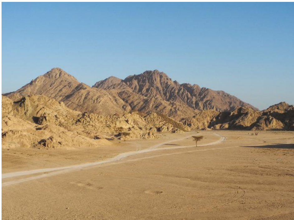
Qua e là, i rari arbusti di acacia dalle radici ostinate.