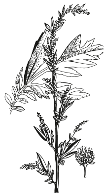
L'Artemisia vulgaris, ingrediente base della moxa

L'inserzione dell'ago da agopuntura è indolore: mentre gli aghi delle comuni si- ringhe sono cavi e hanno una punta a bec- co di flauto che ferisce i tessuti, quelli da